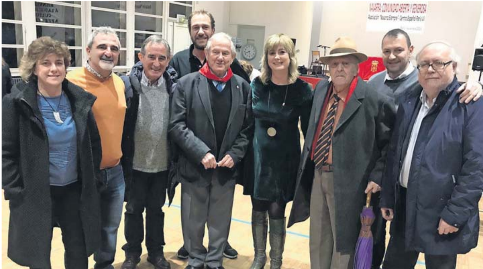
La consejera Olo con los organizadores de la XXXII edición de la Semana Cultural de Navarra en París.